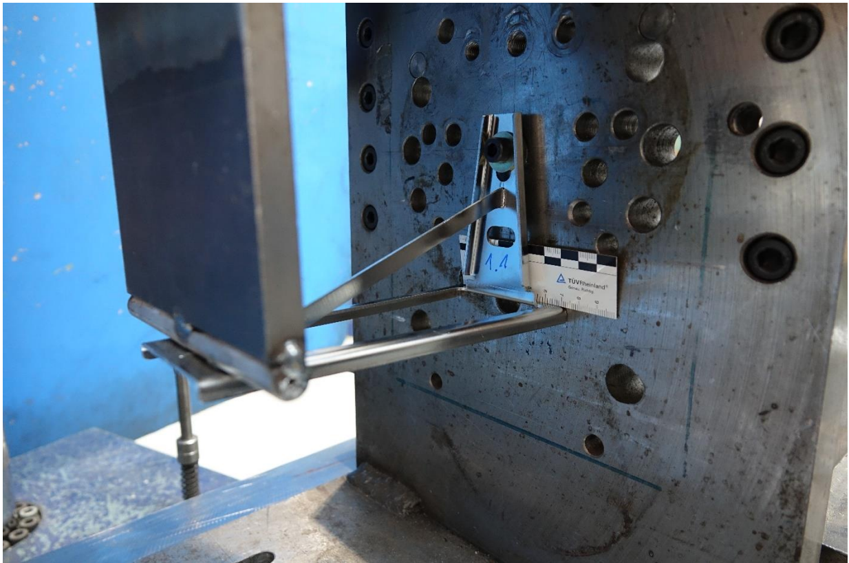
Bild 1. Winkel 1.1 vor Belastung in der Prüfmaschine.