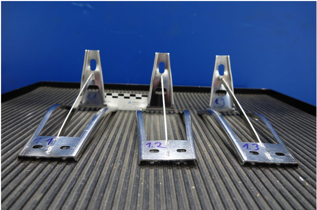
Bild 3. Winkel 1.1 bis 1.3 nach der Belastung.