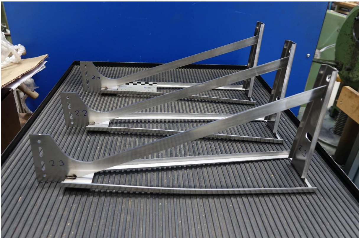
Bild 6. Winkel 2.1 bis 2.3 nach der Belastung