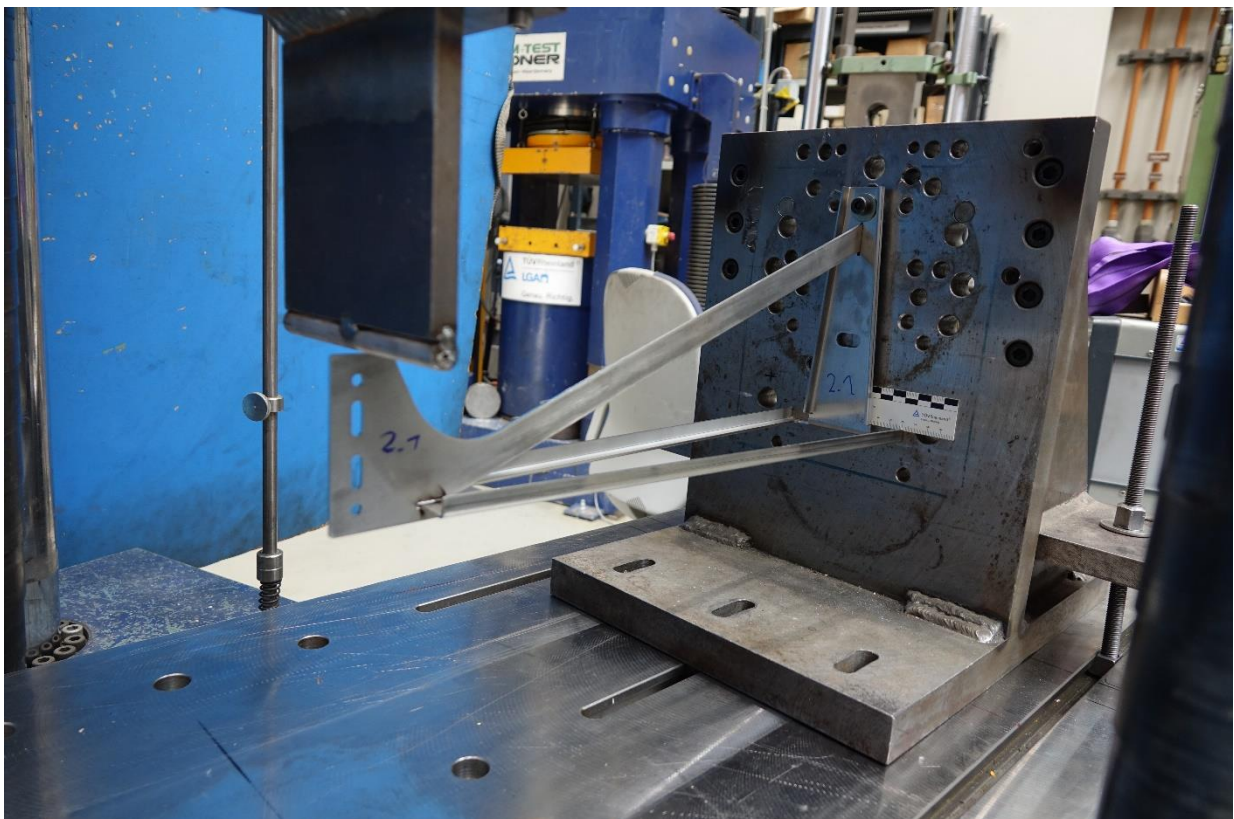
Bild 4. Winkel 2.1 vor Belastung in der Prüfmaschine.